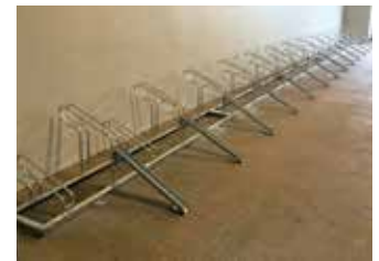
Highタイプ用ガイドレール (オプション)