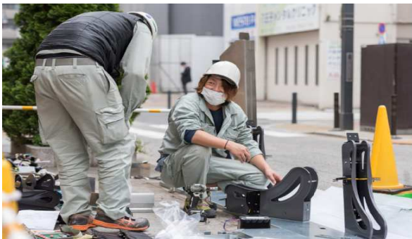
6位：「作業の合間に」 / 12票