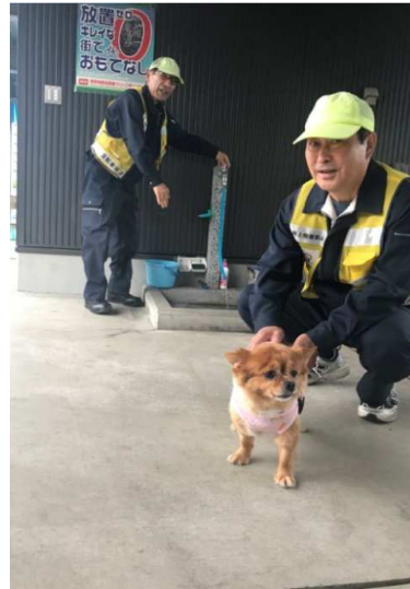
2位：「管理人さんのお友達」 / 14票