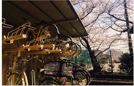
9位：「桜空」 / 8票