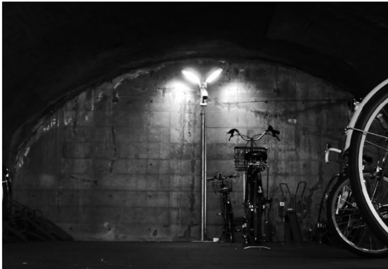
1位： 「無機質」 / 17票