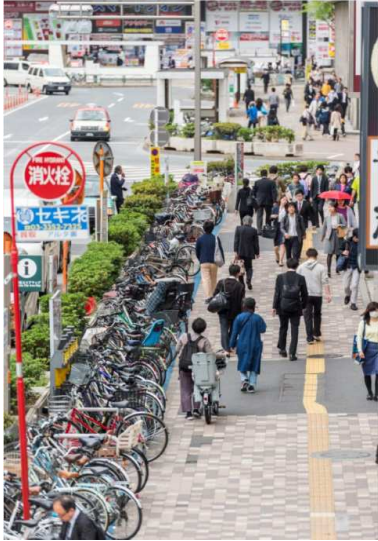
2位：「日常」 / 14票