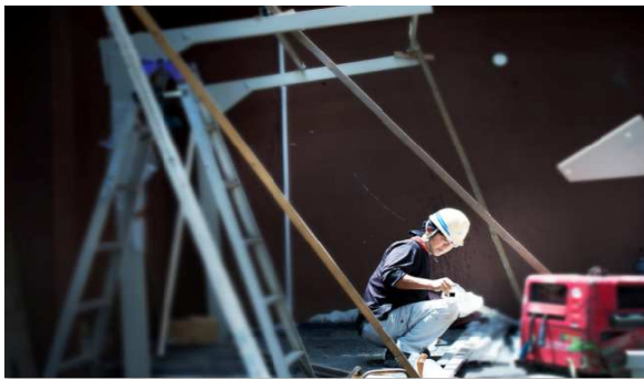
8位：「孤高」 / 10票