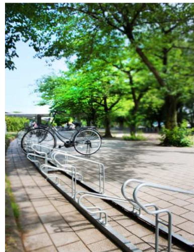
4位：「夏休み」 / 13票