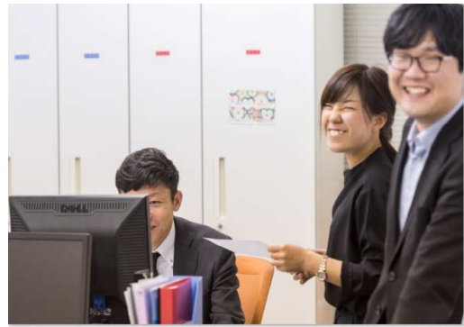
7位：「よかった～」 / 11票