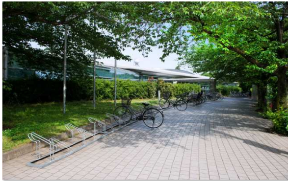
10位：「木漏れ日」 / 7票